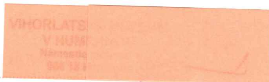
pôvodca odpadu (pečiatka a podpis)