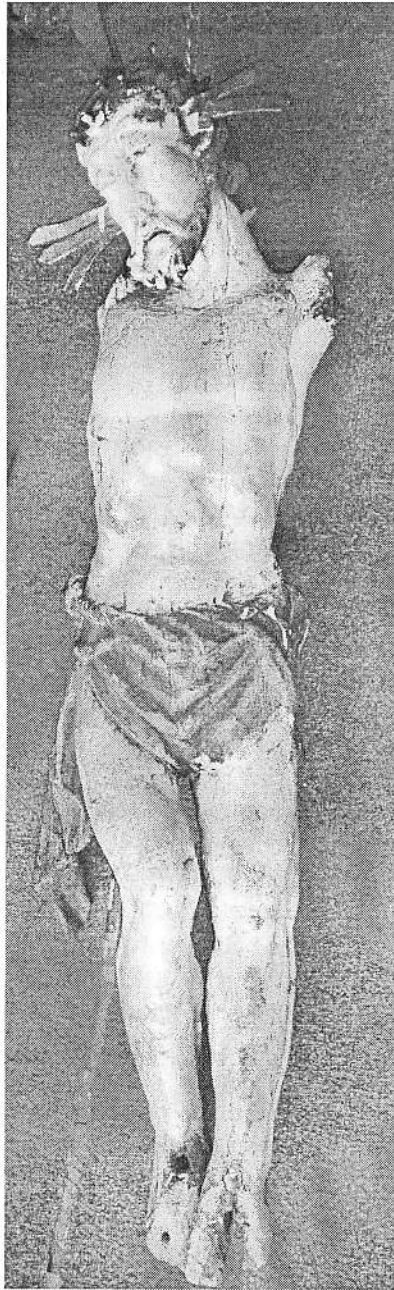
a) Corpus Krista