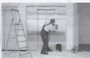
Servis 24 hodín