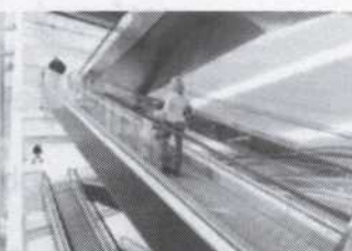
Eskaľátory & pohyblivé chodníky