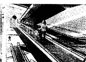
Eskalátory & pohyblivé chodníky