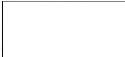
Bc. Katarína Kačmárová riaditeľka SŠJ

Tento dodatok bol zverejnený na webovom sídle prenajímateľa dňa: 13.7.2020